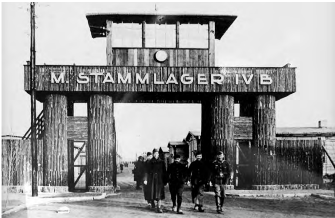
Вход в концентрационный лагерь